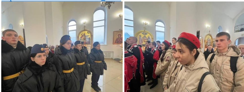
Спуск Государственного Флага