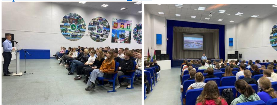
"Мы дети твои, Россия"